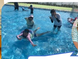
2日目☆プールとキンパ作り